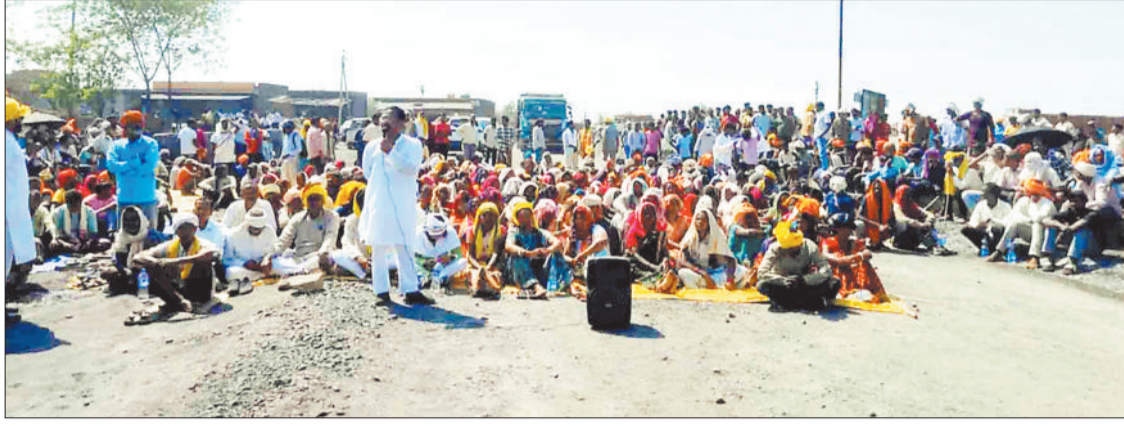
सड़क पर बैठकर चक्काजाम करते ग्रामीण।

क्षेत्र के जगन्नाथपुर में देर रात बिना सूचना के मकान तोड़े जाने के मामले को लेकर लोगों का आक्रोश फूट पड़ा। 25 मार्च की मध्य रात्रि एसईसीएल और पुलिस