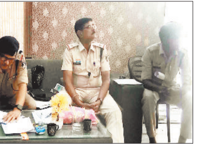
के कमरा नम्बर 109 में रुका था। सुबह होटल के स्टाफ से पानी मंगा कर पिया उसके बाद कमरे को बंद कर लिया।